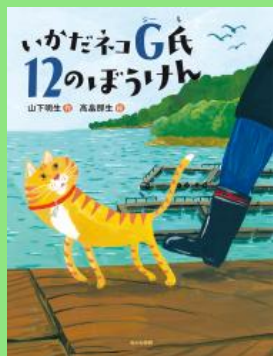
山下 明生／作 あかね書房

人間が出かけていって、ねこはるすばん。 と思いきや、ねこはタンスの奥から、こっ そりねこの街にくりだした！ カフェに 行ったり、ヘアサロンに行ったり、映画 を観たりと、ねこの街を満喫して…。