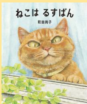
町田 尚子／作 ほるぷ出版