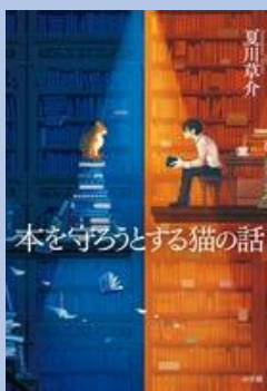
夏川 草介／著 小学館

瀬戸内海の島の入り江に浮かぶ、コッパ養 魚天国。若き社長が始めたばかりの養殖場 で、ネコのG氏が唯一の社員です。初めて のタイの出荷まで、もうすぐ。大切なタイ を無事に出荷するまで、人間もネコも大忙 し！